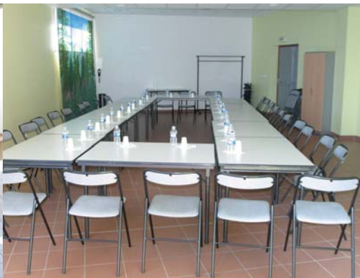
Salle de la Croix des Têtes