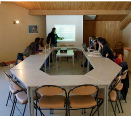
Salle des Airelles